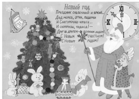
Рис. Курепиной Ксении, 1 Г класс