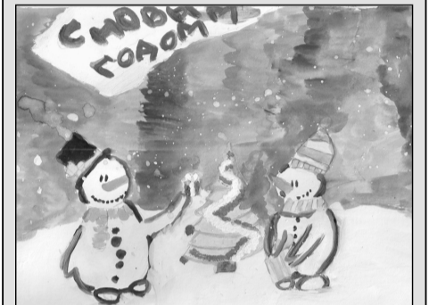
Рис. Погосян Елизаветы, 4 В класс