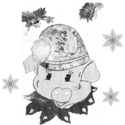
Рис. Давыденко Маргариты, 3 Г класс